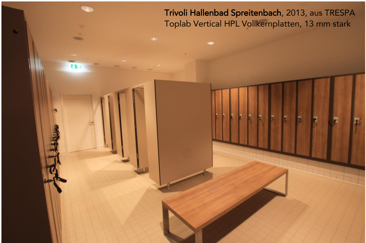
Trivoli Hallenbad Spreitenbach, 2013, aus TRESPA Toplab Vertical HPL Vollkernplatten, 13 mm stark