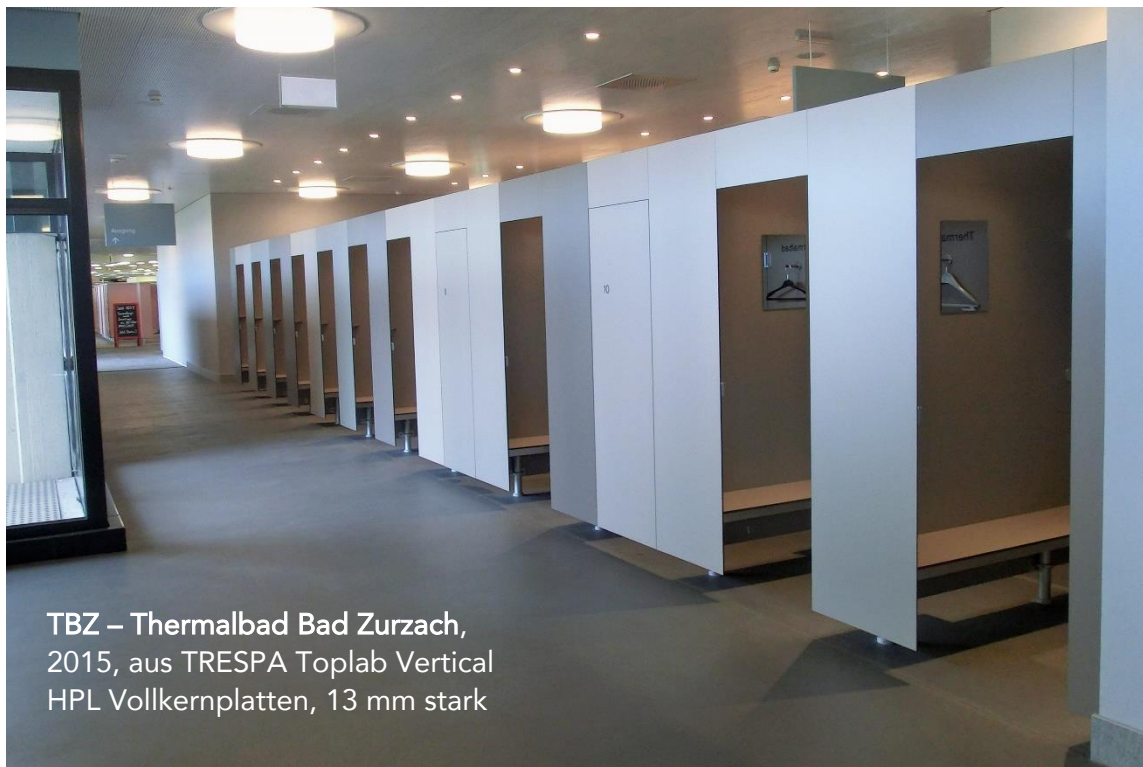
TBZ – Thermalbad Bad Zurzach, 2015, aus TRESPA Toplab Vertical HPL Vollkernplatten, 13 mm stark