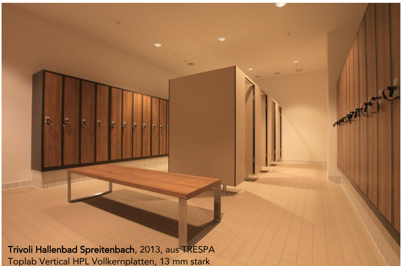
Trivoli Hallenbad Spreitenbach, 2013, aus TRESPA Toplab Vertical HPL Vollkernplatten, 13 mm stark