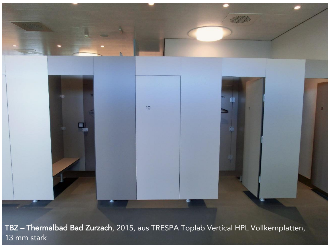
TBZ – Thermalbad Bad Zurzach, 2015, aus TRESPA Toplab Vertical HPL Vollkernplatten, 13 mm stark