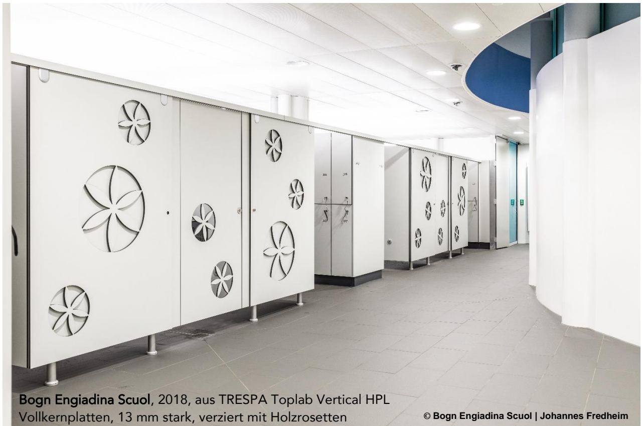
Bogn Engiadina Scuol, 2018, aus TRESPA Toplab Vertical HPL Vollkernplatten, 13 mm stark, verziert mit Holzrosetten